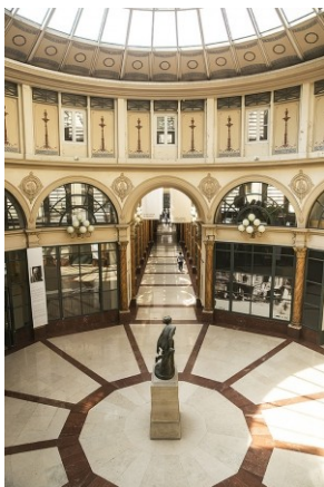
Institut National du Patrimoine