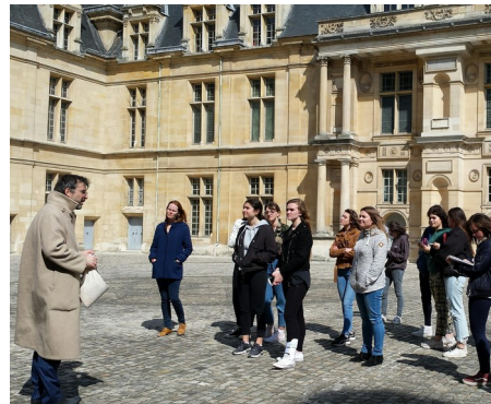
Visite VIP au château d'Écouen