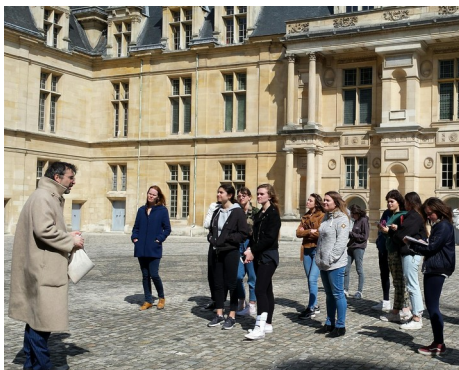
Visite VIP au château d'Écouen